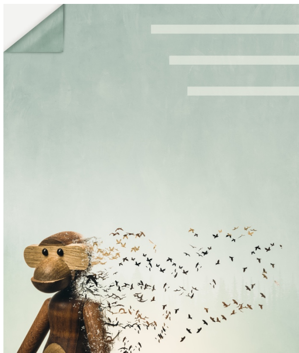
Artwork 1, bildskapare: Uffe Sjökvist. Bildens motiv inspirerat av Kay Bojesens träapa