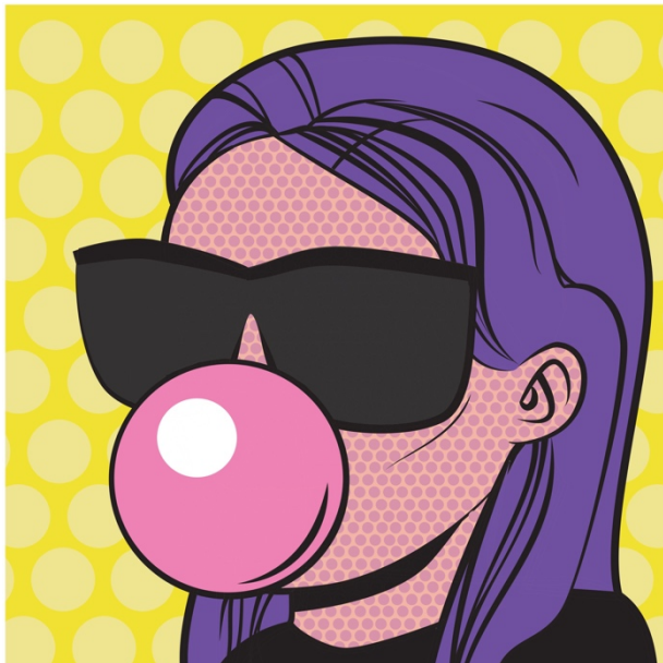
Artwork 2, bildskapare: Fia Gustafsson

Efter att musiken var färdigkomponerad kom jag på titeln ”Save Me” ( se bilaga ”Save Me” för låttext ) som kändes självklar direkt och började skriva texten. Låten kom att handla om att någon vill bli räddad. Jag fastnade för idén om en materialist som är fast i beroendet av materiella ting och såg då kontrasten mellan det organiska i artverket.