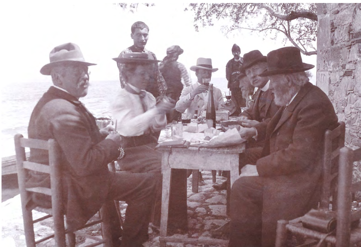
Fotografi på Montelius, andra person från höger, och kända och okända arkeologer under en avslappnad lunch någonstans i den grekiska övärlden 1905.

set i Furusund, ett fotografi taget den sista sommaren som de fick tillsammans (1920). Detta är delvis ett resultat av att kameror blev allt mer vanliga under 1900-talets första hälft, men också ett aktivt val av Baudou, för det finns andra fotografier där Montelius är fångad i rörelse, i livet: läsande en tidning i en syrenberså i Skåne i sällskap med sitt värdpar och deras döttrar under en av sina otaliga arkeologiska expeditioner; på en per-rong i väntan på ett tåg någonstans i Europa; intagande en måltid i Grekland på en liten taverna vid havet med kända och okända kollegor (fig. 1), och så vidare.