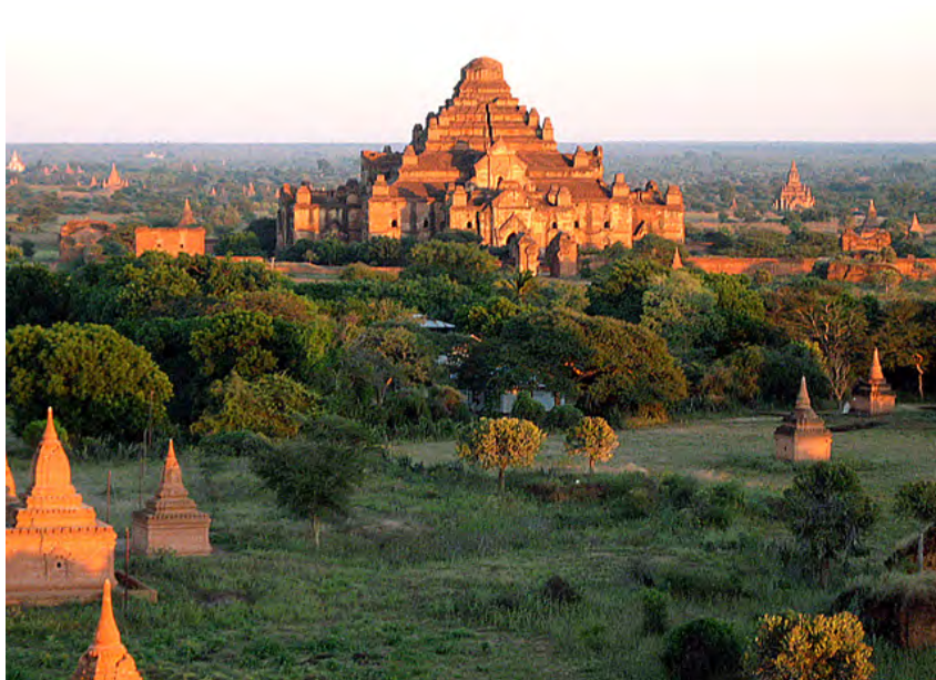
Tempelområde i Myanmar. (Public domain).

gar som lade grunden för Pagans fall, eftersom donationer till helgedomarna försvagade kungamaktens maktbas. Författarna pekar på att detta var ett problematiskt mönster även under senare riksbildningar.