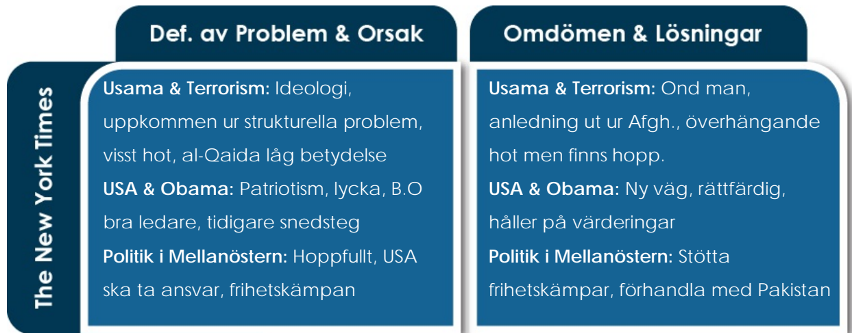
Modell 4.1: Analysschema – Gestaltningen i New York Times