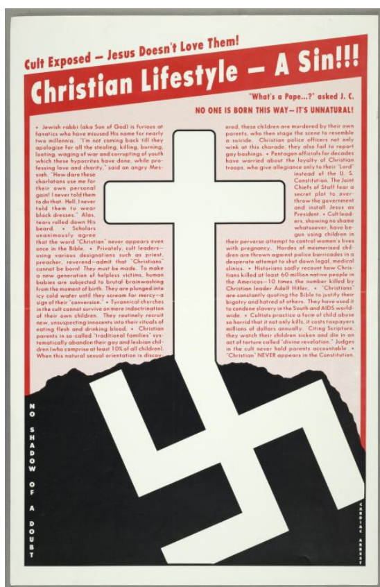
Bild 1. (Undersökningsobjekt 1). Cardiac Arrest, Christian lifestyle – a sin!!! , ACT UP New York (organization). ACT UP New York records.