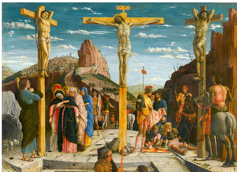
Bild 2. (Exempelbild 1). Andrea Mantegna (1431-1506) Korsfästelsen (1456-1459), tempera på träpanel, Louvre Museum. Paris, Frankrike.

Svastikan/hakkorset kan ha flera betydelser eftersom symbolen förekommer inom flera kulturer, men under det att affischen lämnar referenser till tredje rikets symbolik genom både färg och bildelement har jag reducerat dess symboliska innehåll till dess politiska betydelse. Av den orsaken att jag har studerat en stor mängd av ACT UP: s affischer och därigenom fått kunskap om att organisationen gång på gång drar paralleller till andra världskriget så gör jag bedömningen att min avgränsning kan motiveras.